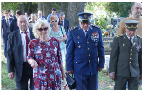
Nové Mesto nad Váhom 28. augusta 2025