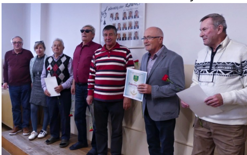
Členská schôdza 23. októbra 2025