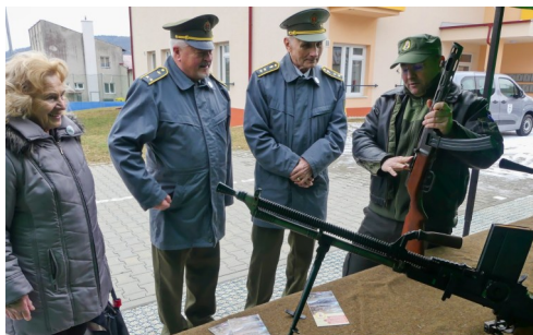
Cetuna 23. februára 2025