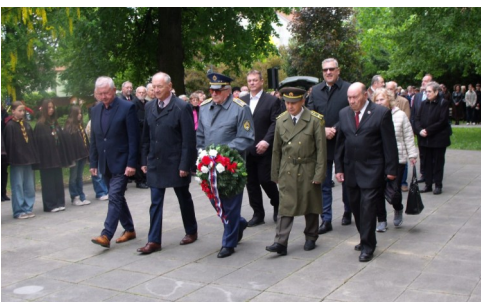
Nové Mesto nad Váhom 7. mája 2025