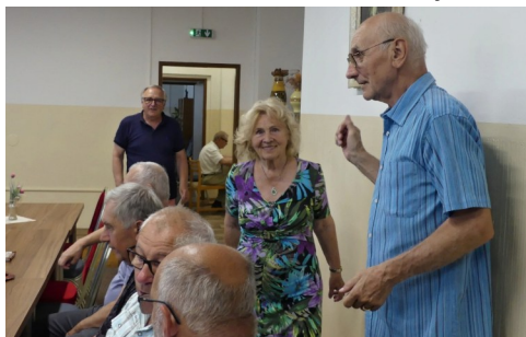
Členská schôdza 19. júna 2025