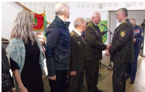
Slávnostná členská schôdza 21. marca 2025