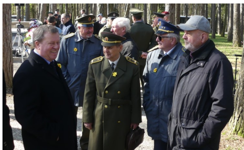
Brezina 10. apríla 2025