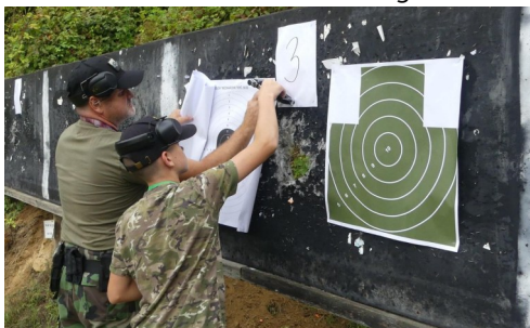
Beckov 30. augusta 2025