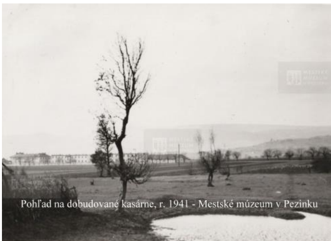
Pohľad na dobudované kasárne, r. 1941