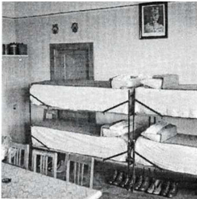
Interiér kasární – Slovenský národný archív, fond Slovenská tlačová kancelária, 1939 – 1945