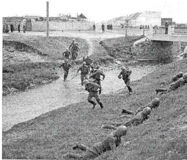
Cvičenie v blízkosti kasární – Slovenský národný archív, fond Slovenská tlačová kancelária, 1939 – 1945

Nimi boli veľkosť staveniska cca 2,5 ha, t.j. plocha 200 x 125 m, resp. 120 x 175 m s možnosťou budúceho rozšírenia na 3,5 ha, nutnosť staveniska voľného a zo všetkých strán prístupného, s možnosťou získania dostatočného množstva pitnej a úžitkovej vody, vzdialeného od infekčných stredísk (močiare, cintorín, trhovisko pre dobytok, kafiléria a pod.). Dôležitá bola aj pôda dostatočnej nosnosti so stálou spodnou vodou v hĺbke od 4 m, možnosť zavedenia elektrickej prípojky a ľahké kanalizovanie s vyústením do mestskej kanalizácie alebo do blízkeho verejného toku. Medzi alternatívy žiadalo vojsko zaradiť hlavne obecné pozemky, ktoré by obec mohla dať k dispozícii bezplatne.